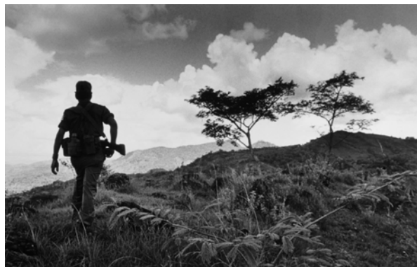
Soldado sobre una colina (Nicaragua) © David Leeson, 1983

De la entrevista de Silvia Isabel Gámez Reforma, México D.F., 24/09/1999